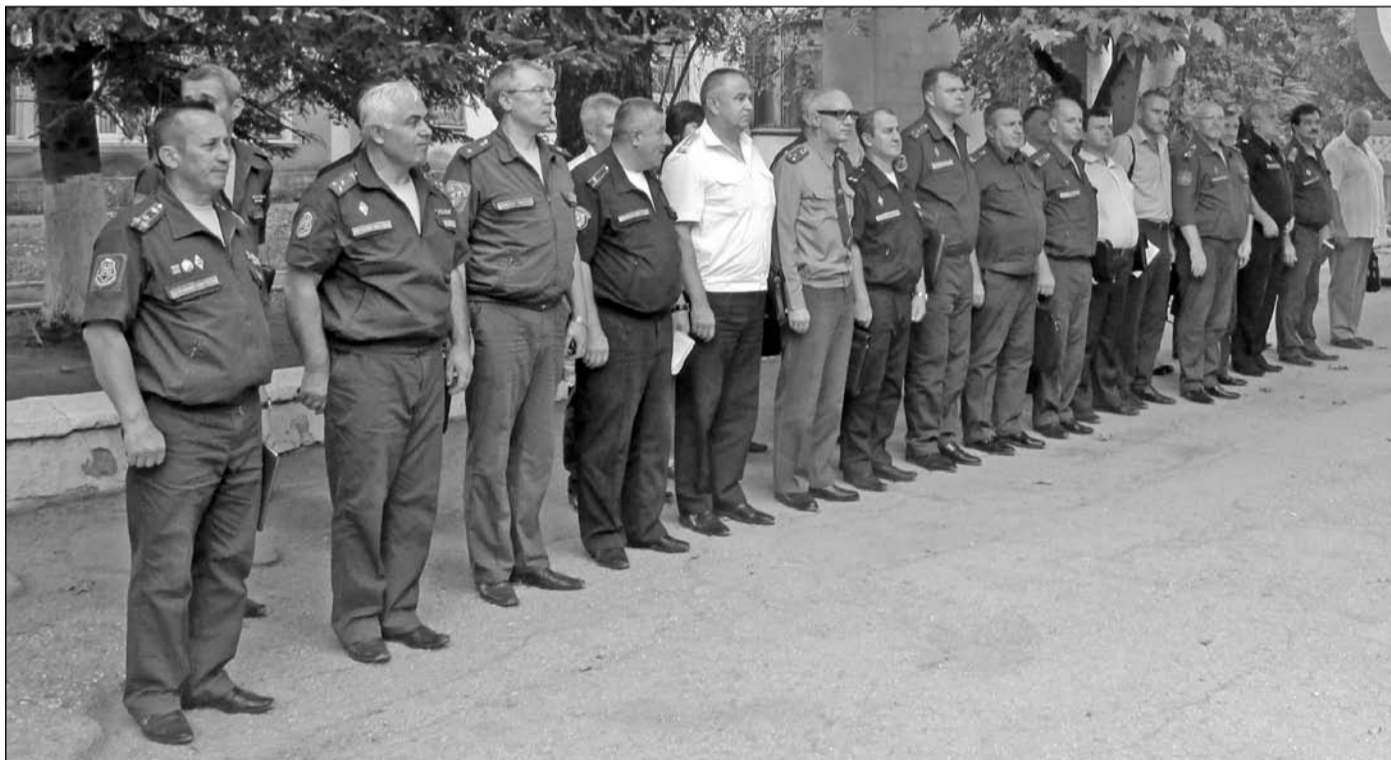
Военкомы городов и районов Республики